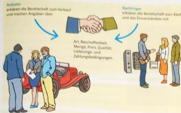
2 Ein Kaufvertrag kommt zustande